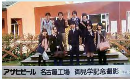
アサヒビール 名古屋工場 御見学記念撮影